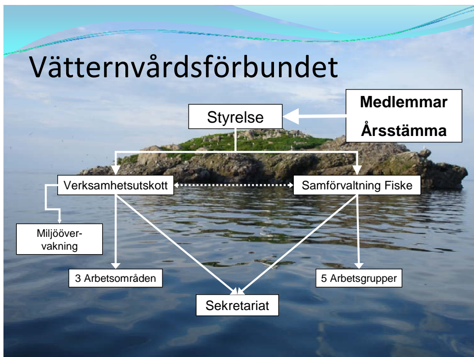
Figur 1. Organisationsschema för Vätternvårdsförbundet.

Samförvaltning Fiske är ett arbetsutskott direkt ställt under Vätternvårdsförbundets styrelse. Arbetet inom Samförvaltning Fiske bedrivs inom arbetsgrupperna, där underlagsmaterial och beslutsförslag tas fram inom respektive arbetsgrupp för att förslag till beslut skall kunna fattas gemensamt inom arbetsutskottet. Slutgiltiga beslut tas av förbundets styrelse. Övergripande frågor och fortlöpande sekretariatsuppgifter sköts av samordnaren.